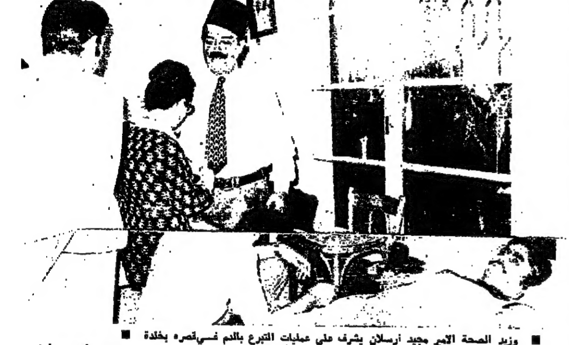
وزير الصحة الأبر مجيد أرسلان يشرف على عمليات التبرع بالدم في منزله

انتهج وزير الصحة الأبر مجيد أرسلان في قصره بخدة أمس، حملة التبرع بالدم، وقد اشترك في هذه الحملة عدد كبير من أبناء الخبطة، وامتنع تعبئة ٤٠ زجاجة بواسطة اطباء ومرشحات المؤسسة الوطنية للصحة (التفاصيل على الصفحة ٢)